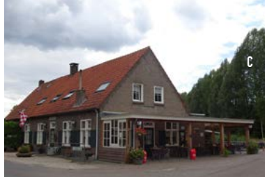
(C) Café 't Groene Woud. In dit café, in de omgeving ook bekend als 'Sien Peijn', werd door een werkgroep van de provincie de naam van de regio Het Groene Woud bedacht.

1. Met je rug naar het gebouw staande, ga je L-af , negeer alle zijwegen en wandel richting de kerk. (A) Voorbij de kerk in de ruime bocht Rechts aanhouden. Links van het Tooseplein blijven lopen en einde weg bij het beeldje van de klompenmaker de weg schuin oversteken en het smalle pad genaamd Kerkpad door Smalder ingaan. Aan het einde van het Kerkepad L-af gaan, weg gaat over in een zand-/grindweg. Einde pad R-af , bij bord bebouwde kom Liempde volg het pad achter de bomen door en volg de gele palen en gele aanduidingen langs het weiland.